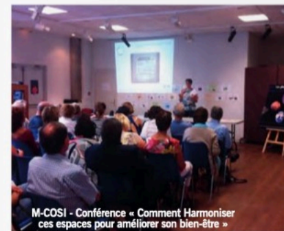
M-COSI - Conférence « Comment Harmoniser ces espaces pour améliorer son bien-être »

Plus que jamais, il est nécessaire de prendre soin de son habitat pour prendre soin de soi.