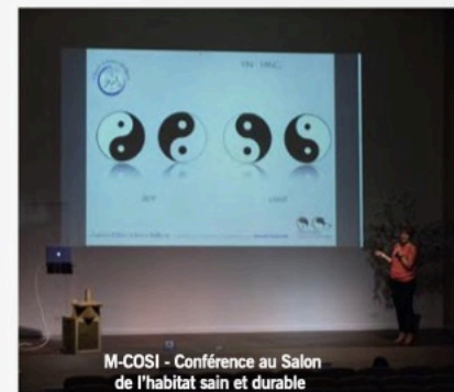
M-COSI - Conférence au Salon de l'habitat sain et durable