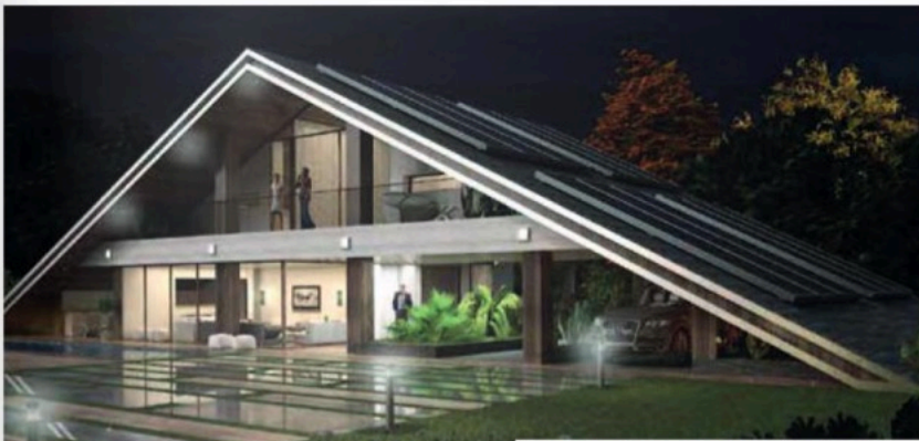
CREA IMMOBILIER - Maison «Coucou» 'habitat bio-compatible

pour les faire en quelque sorte « cohabiter », en harmonie et créer ainsi un équilibre parfait. Elle préconise parfois, l'utilisation de symboles et de jeux de lumières, afin de (re)donner du sens aux espaces et créer une certaine unité.